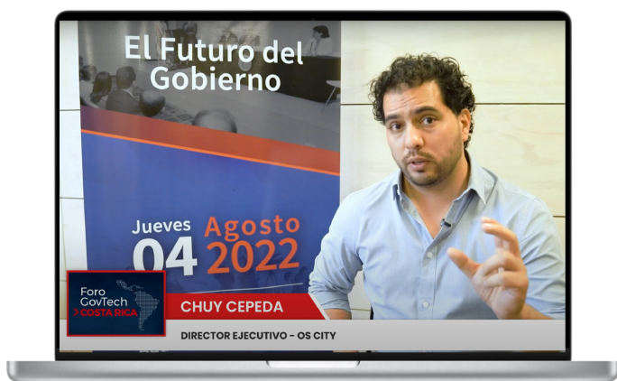
Capsula 01: Ver entrevista