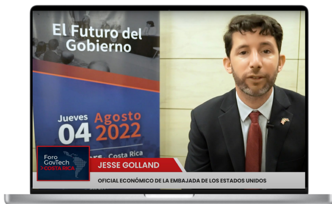
Capsula 04: Ver entrevista