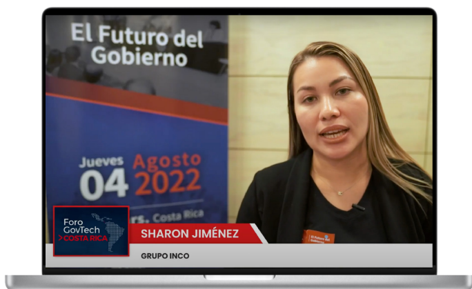
Capsula 03: Ver entrevista