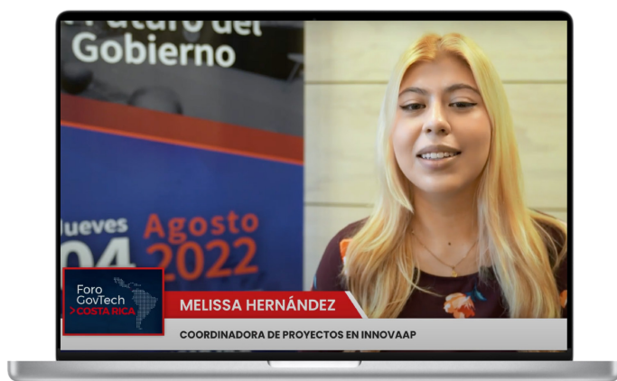
Capsula 02: Ver entrevista